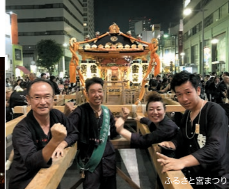
ふるさと宮まつり