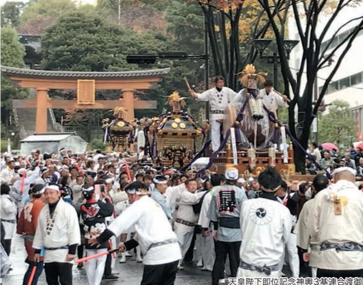
天皇陛下即位記念神輿3基連合渡御