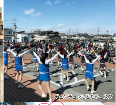
チュンチュンこどもフェスタ