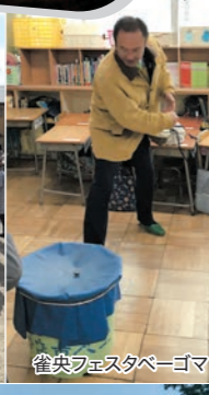
雀央フェスタペーゴマ