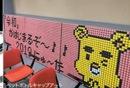
ペットボトルキャップアート