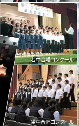
若中合唱コンクール