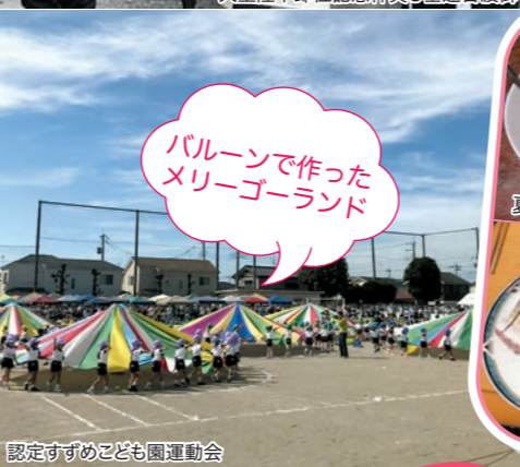
バルーンで作ったメリーゴーランド