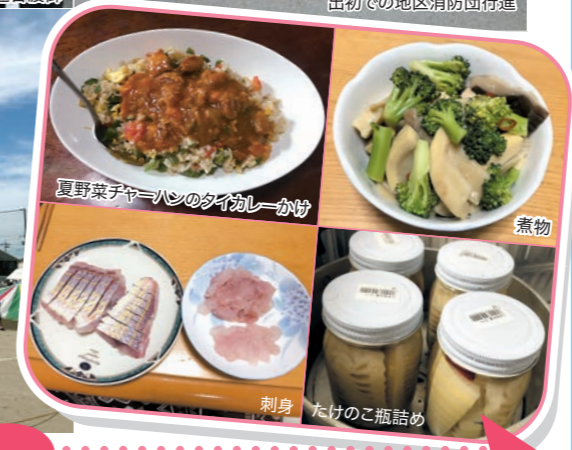
夏野菜チャーハン・タイカレーかつ