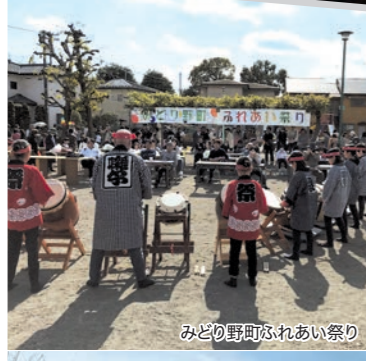
みどり野町ふれあい祭り