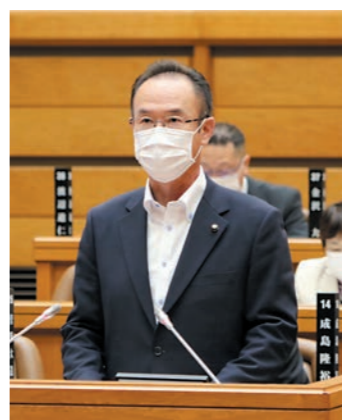
5月臨時議会でのコロナ関係議案への質疑 臨時議会で審議されたコロナ関連の補正予算案に対し、会派を代表して質疑を行う。

6月 交通・観光レジャー・飲食等の産業やスポーツ・文化・芸術分野への支援、生活困窮世帯や学生への支援強化、交付金・助成金・給付金等の増額、教育格差是正策、治療法・感染予防薬・簡易検査キット等の開発支援、避難所での感染防止対策、迅速な給付等が行える仕組みの構築