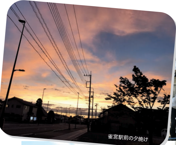
雀宮駅前の夕焼け