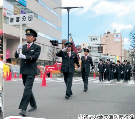
出初での地区消防団行進