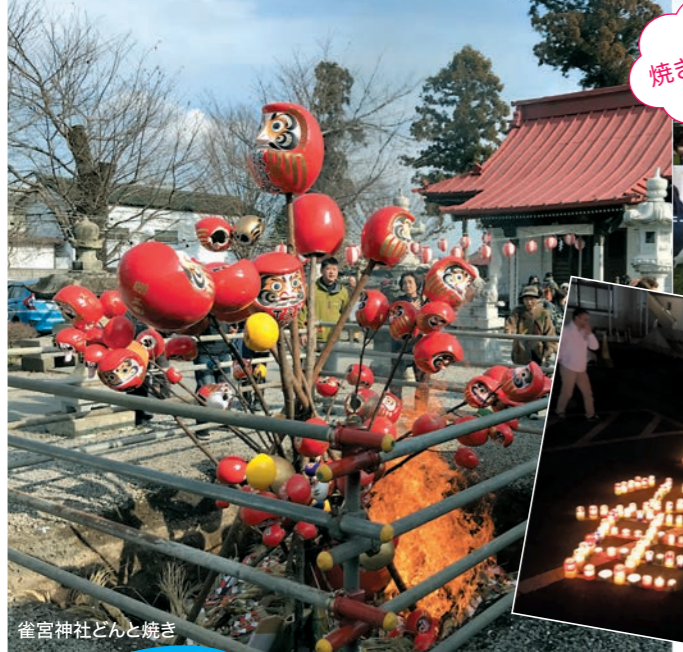
雀宮神社どんと焼き