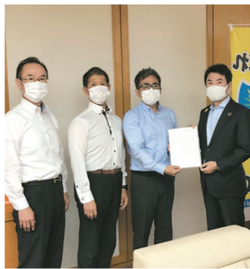
市へ3回目のコロナ要望書提出

5月 プレミアム商品券の導入、中小事業者への継続した支援、DV・虐待や精神的影響を受けている市民への対応、病院や高齢者施設などへの支援、学校単位での休校、ICT（情報通信技術）を活用した学習補助体制の整備、避難所での感染予防、風評被害の防止、感染拡大予防と経済や社会活動を両立させる基準策定、経験や科学や統計に基づいた第2波への備え